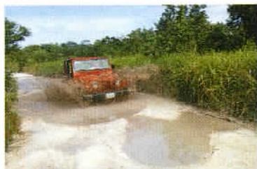
Dans le Yucatan, il est possible de sortir des sentiers battus.

Après, direction Campeche à 152 km au sud-ouest d'Uxmal, dont les richesses excitèrent, au XVII e siècle, la convoitise d'un grand nombre de corsaires et flibustiers parmi lesquels le Français Lafitte. Ce qui décida la Couronne d'Espagne à protéger la ville à partir de 1668 au moyen de puissants remparts, dont les vestiges subsistent encore. Campeche forme un autre bel exemple d'architecture coloniale et colorée, avec par ailleurs une jolie croisière qui court sur quelques kilomètres le long du golfe du Mexique. C'est là, à proximité du centre ville, que se trouve l'Hôtel