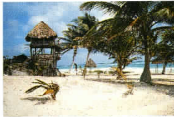
Au bord des Caraïbes, le sable est toujours poussière de corail...

Puis cap sur Palenque, l'incontestable temps fort culturel de notre périple et la plus longue étape, car elle ne représente pas moins de 525 km, au sud-ouest de Campeche. Mais la récompense existe bel et bien au bout du chemin ! L'éblouissement que l'on ressent à la vision de la cité du roi Pacal le Grand émergeant de