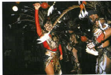
Un ballet folklorique dédié à la civilisation aztèque.

pour le plus grand plaisir des cohortes des touristes. Nous suggérons par conséquent à nos lecteurs de prendre possession d'un 4x4 de location grâce à l'une des nombreuses compagnies présentes à l'aéroport, afin de démarrer le voyage au plus tôt. La première étape de notre circuit nous conduit de Cancun à Chichén Itzá, soit 230 km vers l'ouest que l'on peut couvrir par l'autoroute, surtout pour un voyage de nuit comme ce fut notre cas. Inconvénient mineur : le prix du péage assez élevé, comme sur toutes les autoroutes mexicaines. Cependant, il