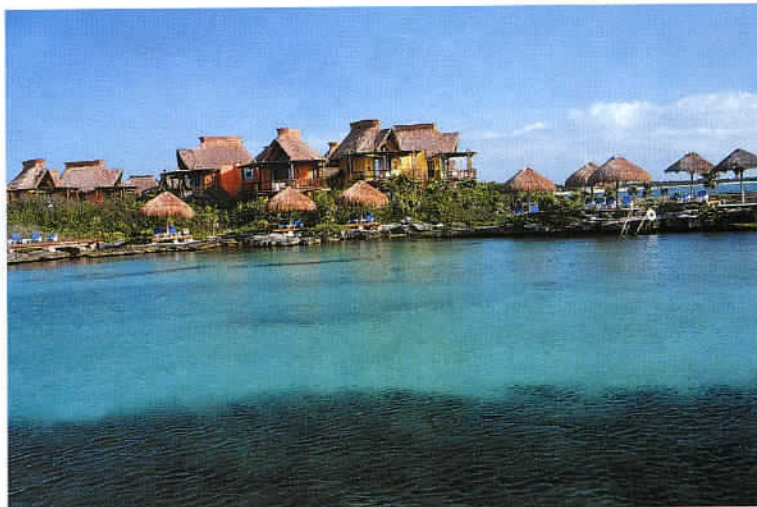
Le Xpu-Ha Palace : un paradis pour la détente et les sports aquatiques. Une infrastructure luxueuse, parfaitement intégrée au sein d'un parc écologique.