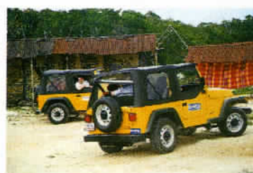
Au Mexique, le litre d'ordinaire vaut 5,10 pesos, soit environ 0,50 €.

un camping entouré par la jungle, près de vasques naturelles d'un blanc étincelant contenant une eau turquoise... Assurément, l'un des plus remarquables paysages mexicains ! L'antépénultième étape du voyage offre une halte roborative à l'Eco-Village à 2 km de Becan et environ 320 km au nord-est de Palenque, en direction de Chetumal. Cet hébergement écologique permet de couper une trop longue étape sur le chemin du retour vers Cancun. On dort dans de ravissants bungalows, les repas étant servis dans un charmant petit restaurant, avant d'atteindre la fantastique conclusion de ce voyage, à savoir le Xpu-Ha Palace, perle de la Riviera maya. Auparavant, à 250 km au nord de Chetumal, la visite matinale ou en fin de journée du site de Tulum