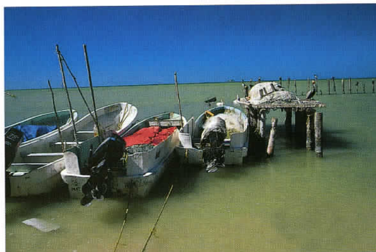
Dans le golfe du Mexique comme dans tout le pays, la pêche demeure un secteur de l'activité économique délaissé, malgré 11 500 km de côtes.