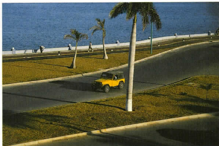
Les Mexicains mettent les clignotants à droite pour céder le passage et à gauche pour dissuader de dépasser.