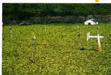
Un terrain de basket et une chapelle dans un village inondé.

seur de Pacal, d'entrer en contact avec les âmes de ses ancêtres. A voir aussi, le Templo de la Cruz , le plus grand des trois oratoires, le Templo del Sol et El Palacio qui possède de magnifiques reliefs modelés en stuc... La liste est si longue qu'il convient de prendre son temps à Palenque, dont la découverte est une nouvelle fois préférable, très tôt le matin ou l'après-midi, quand les derniers cars de touristes ont levé le camp. A signaler la présence d'un musée fort intéressant auquel on accède par un sentier à travers bois. Palenque, c'est aussi une plaisante petite ville touristique qui accueille encore nombre de hippies et surtout d'Indiens vendeurs de produits artisanaux. Ici, nous vous indiquons l'hôtel Ciudad Real. A 62 km au sud de Palenque se trouve un extraordinaire coin de nature que les amateurs de 4x4 goûteront à sa juste valeur : les Cascades d'Agua Azul auxquelles on accède par une mauvaise route de 4,5 km et qui possède