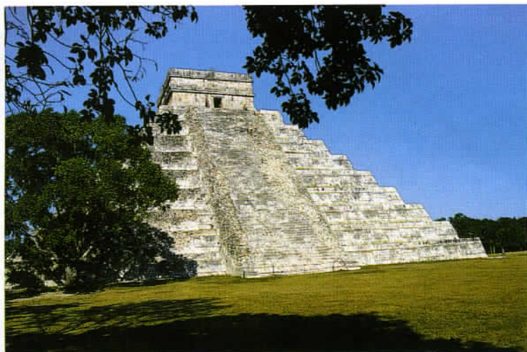
Sur la pyramide de Chichén Itzá, les 365 jours de l'année solaire sont symbolisés par quatre escaliers de 91 marches chacun et un emmarchement.