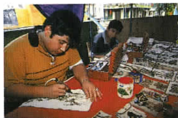
La pyrogravure : une spécialité artisanale très présente à Palenque.

pour le plus grand plaisir des cohortes des touristes. Nous suggérons par conséquent à nos lecteurs de prendre possession d'un 4x4 de location grâce à l'une des nombreuses compagnies présentes à l'aéroport, afin de démarrer le voyage au plus tôt. La première étape de notre circuit nous conduit de Cancun à Chichén Itzá, soit 230 km vers l'ouest que l'on peut couvrir par l'autoroute, surtout pour un voyage de nuit comme ce fut notre cas. Inconvénient mineur : le prix du péage assez élevé, comme sur toutes les autoroutes mexicaines. Cependant, il