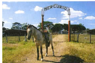
Le cheval : une créature sacrée pour les populations préhispaniques.

Après, direction Campeche à 152 km au sud-ouest d'Uxmal, dont les richesses excitèrent, au XVII e siècle, la convoitise d'un grand nombre de corsaires et flibustiers parmi lesquels le Français Lafitte. Ce qui décida la Couronne d'Espagne à protéger la ville à partir de 1668 au moyen de puissants remparts, dont les vestiges subsistent encore. Campeche forme un autre bel exemple d'architecture coloniale et colorée, avec par ailleurs une jolie croisière qui court sur quelques kilomètres le long du golfe du Mexique. C'est là, à proximité du centre ville, que se trouve l'Hôtel