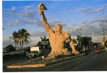
Le flambeau de la liberté garde l'entrée de la cité de Campeche.

existe une alternative : une route nationale gratuite et en bon état, de même que l'ensemble du réseau routier yucatéque, à emprunter toutefois exclusivement de jour, compte tenu de la conduite nocturne quelque peu téméraire des Mexicains et de la relative indigence de la signalisation. Chichén Itzá, dont le nom signifie le puits des Itzas en langage vernaculaire, était une cité fondée au VIII e siècle par la tribu maya éponyme, empreinte de style architectural toltèque. Elle doit donc son appellation à la proximité d'un Cenote, une excavation de 60 mètres