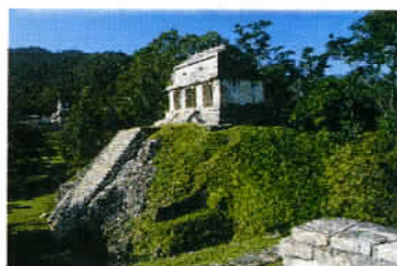
Palenque, un site inscrit au patrimoine de l'UNESCO depuis 1987.

Louer un 4x4 Nouvelles Frontières propose également des locations de 4x4, au départ de Cancun : une Jeep Wrangler bâchée, 2 portes et 4 passagers à partir de 874 € pour 8 jours. Location de véhicule à laquelle on peut associer une gamme variée d'autotours d'une durée de 6 à 15 jours, couvrant le Yucatan et Palenque, à partir de 220 € la semaine, en chambre double, logement seul.